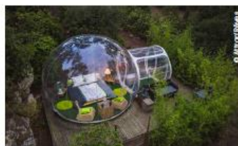
Attrap'Rêves, Allauch, Francia