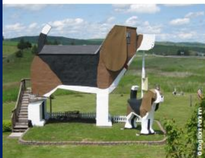
Dog Bark Park Inn, Cottonwood, USA