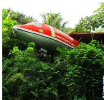
727 Fuselage Home, Costa Rica

Lo sapete che la Costa Rica è una delle zone blu del mondo dove si vive più a lungo? Se state progettando delle vacanze (o una pensione) fuori dal comune, non potete non visitare il 727 Fuselage Home . C'è chi visita l'aeroporto come una destinazione, poi ci sono gli aerei che atterrano in giardino: un Boeing 727 del 1965 è stato trasformato nella suite di un hotel esclusivo . Sembrerà di essere precipitati al centro di una giungla ma in realtà 727 Fuselage Home è l'hotel più in voga del paese. Vi sembrerà di volare, le originali stanze sono infatti letteralmente sospese tra gli alberi e l'intera struttura offre scorci panoramici mozzafiato. Mentre i più grandi si rilassano tra comfort e trattamenti di prima classe, i più piccoli possono giocare a fare i piloti tra i comandi della vecchia consolle e giochi di simulazione di volo. L'unica pecca è un ambiente ristretto e limitante, in grado di ospitare solo un esiguo numero di ospiti.